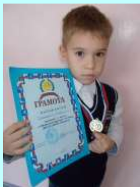
ВСЕВОЛОЖСКИЙ РАДИОН I МЕСТО В ОТКРЫТОМ ТУРНИРЕ ПО БОКСУ Г. АКСАЙ