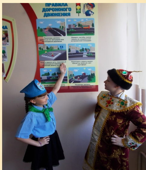
На фото отряд ЮИД (4 А кл.)

4. Выходить на проезжую часть дороги из-за стоящего транспортного средства или иного объекта, ограничивающего обзорность дороги, не убедившись в отсутствии приближающихся транспортных средств.