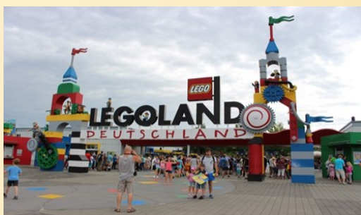
Леголенд, г. Гюнцбург, Германия

Из Чехии мы отправились в Германию, в город Гюнцбург. Я очень ждал поездки в этот город, поскольку там находится Леголенд. Леголенд - это огромный парк с аттракционами, где большая часть состоит из деталей конструктора Лего. На посещение Леголенда был отведен целый день. Описать это место словами невозможно, это мечта всех детей и там обязательно нужно побывать. Мы прокатились практически на всех аттракционах парка. Меня также поразили фрагменты городов, сделанные из деталей конструктора.