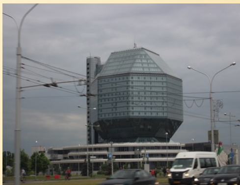
город Минск, Беларусь

Лето 2017 года выдалось для меня особо интересным и насыщенным событиями. Мы с мамой, папой и моей сестрой запланировали поездку в Европу на машине. Нам предстояло посетить восемь стран: Беларусь, Польшу, Чехию, Германию, Австрию, Италию, Словению и Хорватию. А время, проведенное вне дома, оценивалось длиною в один месяц.