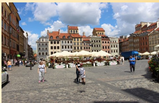
Старый город, Варшава, Польша

Из Минска мы направились в столицу Польши город Варшаву, где мы посмотрели Старый город, который является одной из самых известных достопримечательностей страны. В Польше мы провели всего один день, поскольку спешили в Чехию, где мне предстояло провести неделю в международном хоккейном лагере.