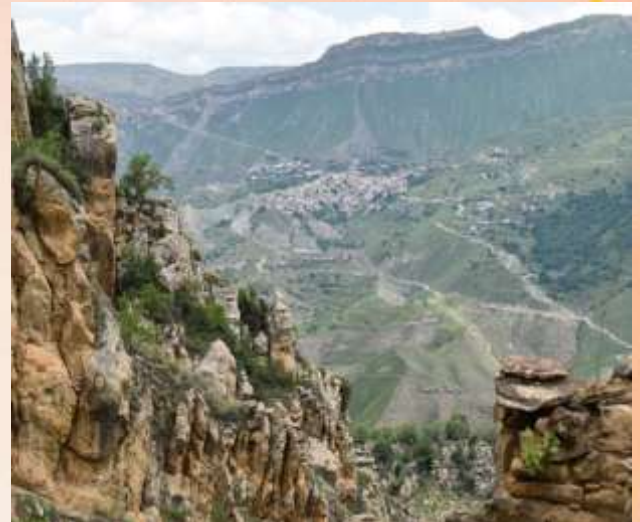
Дюбенюк Яна 2 Е класс.