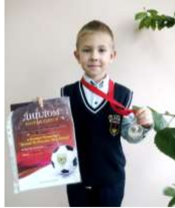
Колендо Николай II место

Образцовый ансамбль танца «Мери-денс» г.Аксай Международный конкурс хореографического искусства «ДОРОГА К СОЛНЦУ»