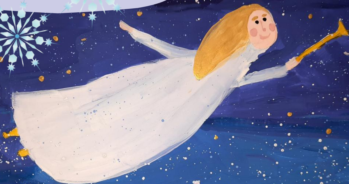
Рисунок обложки - Медведок Милена 2Е класс

Ответственный редактор, технический редактор - Пискунова Е.В.