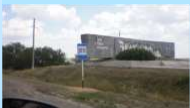
В Сальске перед Маньчским водохранилищем.