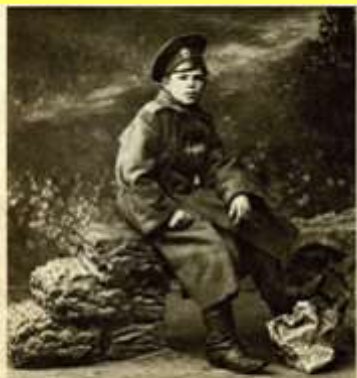
Мальчишки в форме, отправленные на фронт, 1914-1918 гг.

Русские мальчишки. Когда Отчизна в опасности, в их детских душах пробуждается трепетное чувство патриотизма, любви к истерзанной и страдающей Родине. Убежавший на Первую Отечественную войну 1812 года пятнадцатилетний Петя Ростов из «Войны и мира» пишет отцу: «Прощайте, дорогие родители, я еду оборонять Россию!»