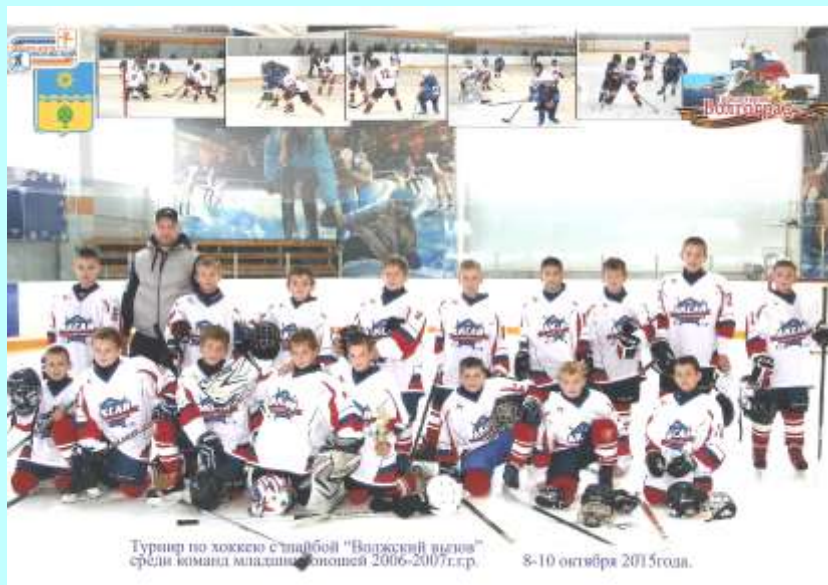
Турнир по хоккею с шайбой «Волжский вызов» среди команд младших классов 2006-2007г.г.