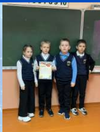
Команду 2 «Д» класса за III место в викторине в рамках декады математики