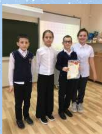
Команду 3 «Е» класса за II место в викторине в рамках декады математики