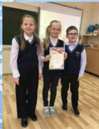
Команду 3 «Б» класса за I место в викторине в рамках декады математики