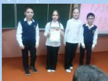
Команду 4 «Г» класса за II место в викторине в рамках декады математики