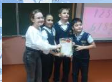
Команду 4 «А» класса за I место в викторине в рамках декады математики