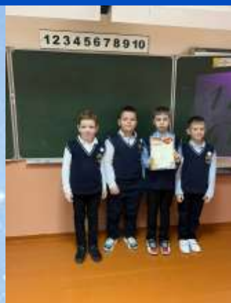
Команду 2 «Е» класса за II место в викторине в рамках декады математики