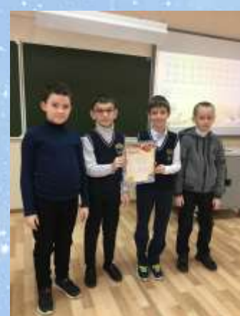
Команду 3 «Д» класса за III место в викторине в рамках декады математики