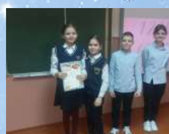
Команду 4 «Е» класса за III место в викторине в рамках декады математики