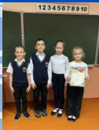
Команду 2 «В» класса за I место в викторине в рамках декады математики