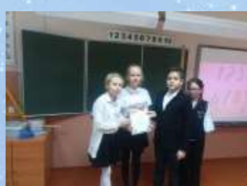
Команду 4 «Б» класса за III место в викторине в рамках декады математики