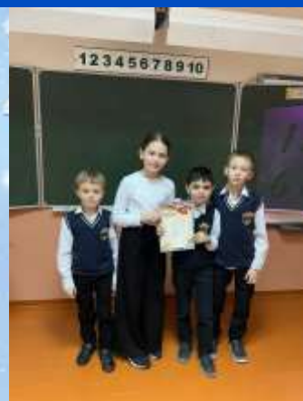
Команду 2 «А» класса за III место в викторине в рамках декады математики