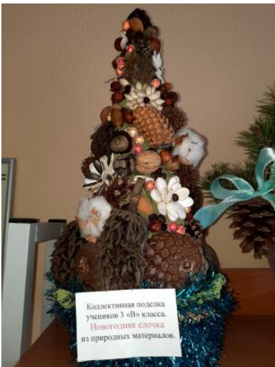
Коллективная поделка учеников 3 «В» класса. Новогодняя елочка из природных материалов.

Сколько труда, терпения и любви вложено в каждую новогоднюю поделку.