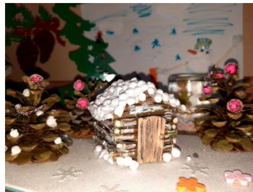
Самодельная Елочка 2-й класс

На фото можно увидеть лишь некоторую часть работ, представленных на школьной выставке.