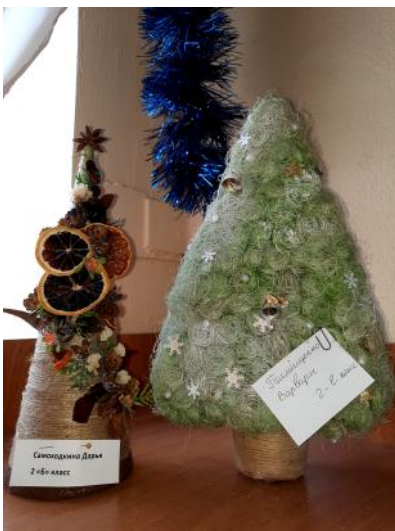
Самодельная Елочка 2-й класс

Все классы украшены к Новому году, в каждом - красавица елочка! Горят огоньки, вокруг царит атмосфера праздника и чудесного настроения.