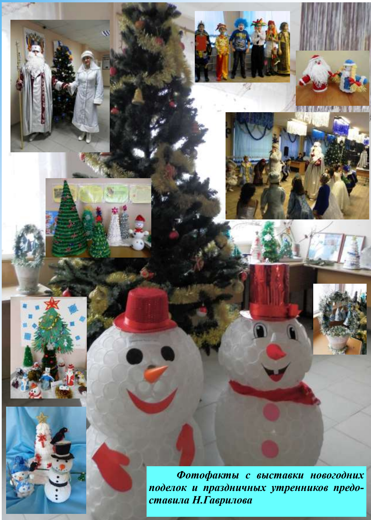
Фотофакты с выставки новогодних поделок и праздничных утренников представила Н.Гаврилова