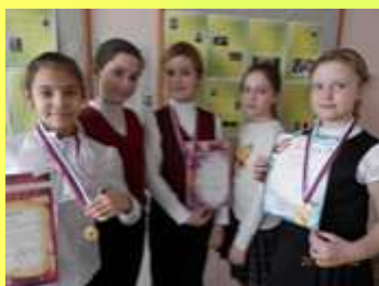
Участники приёма «ГОРДОСТЬ ЗЕМЛИ АКСАЙСКОЙ» у главы Аксайского р-на