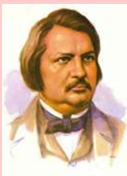
писатель Оноре де Бальзак