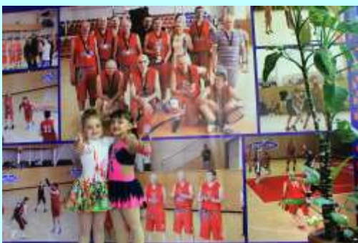
С подругой по клубу

В нашу семью акробатический рок-н-ролл пришел как раз в период моего появления на свет. Моя старшая сестра к этому времени уже начала заниматься рок-н-роллом, этим прекрасным видом спорта, в клубе «Континент-Дон». Что такое акробатический рок-н-ролл? Это завораживающий постановочный танец с хореографическими и акробатическими элементами,