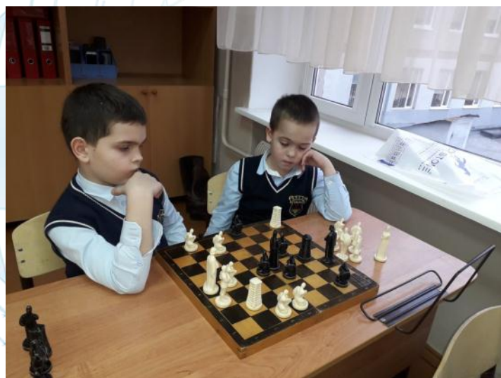
Ученики 3 Б готовятся к шахматному турниру