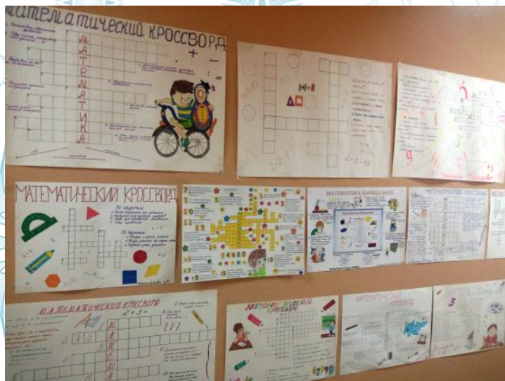
Кроссворды составленные учениками 2х классов