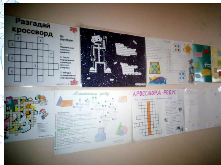
Кроссворды составленные учениками 2х классов

Проведение декады математики в нашей школе уже стало традицией. Проводится она один раз в год после зимних каникул. За это время ученики решают творческие задачи, ребусы, кроссворды. Проходят классные часы, посвященные математике.