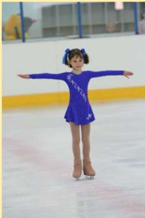
Фото из семейного архива