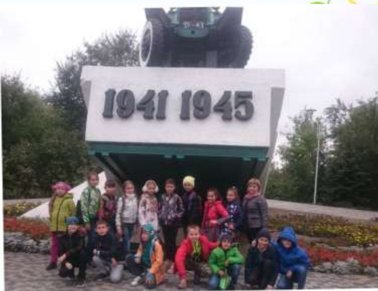
Фото предоставлены автором.