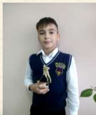
Лучший игрок матча

Лауреат 1 степени 8 международный фестиваль- конкурс детского и юношеского творчества Звездная Фиеста Номинация— народный вокал Возраст 7-9 лет