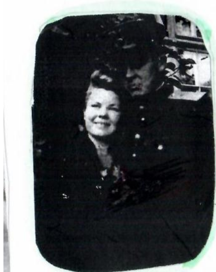
Прадедуска и прабабушка, Австрия, 1945 год

Витя Прядка 1Б класс