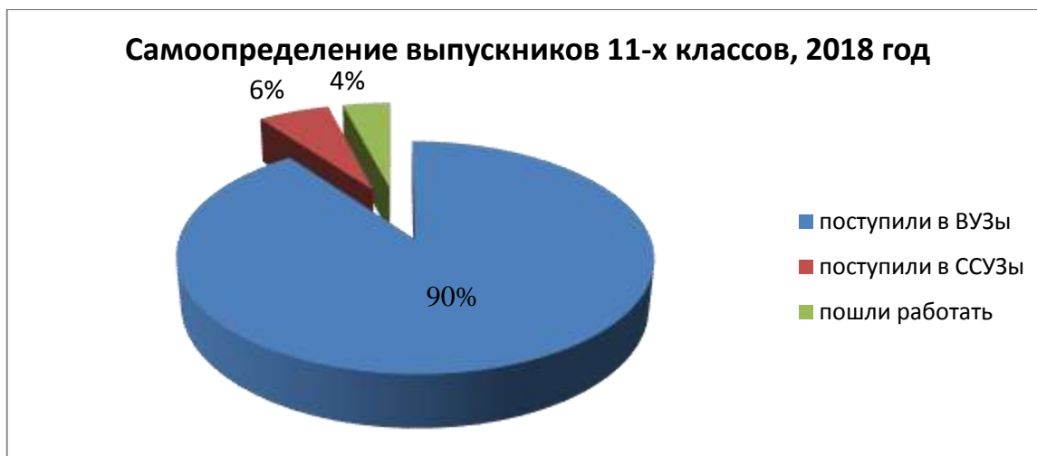
Диаграмма № 13

Анализ трудоустройства выпускников показывает, что большинство учащихся 11-х классов выбрали для поступления те ВУЗы и ССУЗы, которые соответствовали профилю обучения на уровне среднего общего образования: